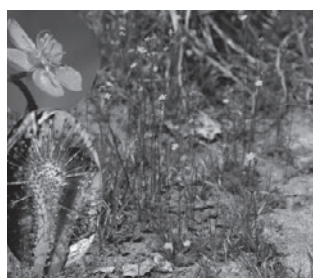
トウカイコモウセンゴケ (モウセンゴケ科)