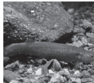
ホトケドジョウ (ドジョウ科)