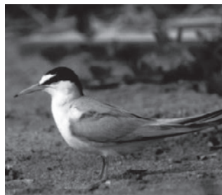
コアジサシ (カモメ科)