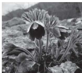
オキナグサ (キンポウゲ科)