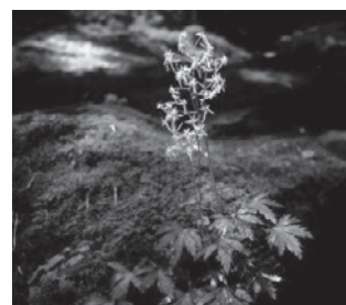
エチゼンダイモンジソウ (ユキノシタ科)