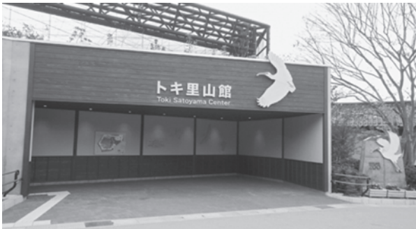
トキ里山館（平成28年11月オープン）

今後も、トキを通じて里山の利用保全を推進するなど、人と自然の共生の取組を進めていきたいと考えています。