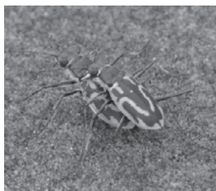
イカリモンハンミョウ (ハンミョウ科)