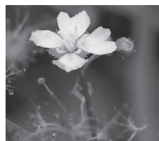
イシモチソウ (モウセンゴケ科)