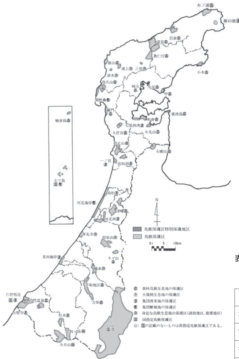
図2 鳥獣保護区と指定等現況図 (令和3年3月末現在)