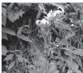
サドククルマユリ (ユリ科)