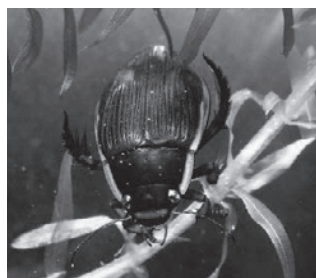
シャープゲンゴロウモドキ (ゲンゴロウ科)