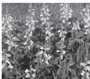
センダイハギ (マメ科)