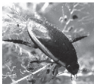
マルコガタノゲンゴロウ (ゲンゴロウ科)