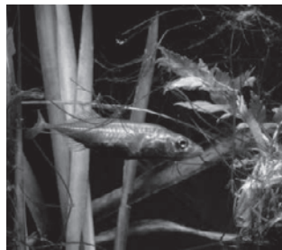
トミヨ (トゲウオ科)