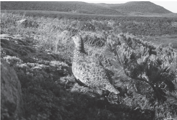
白山のライチョウ（平成27年8月24日撮影、環境省中部地方環境事務所）

白山は、かつてのライチョウの生息地であり、平成21年6月のライチョウの再確認は、大きなニュースとなって県民に明るい話題を提供しました（のちの調査で平成20年にライチョウが確認されていたことが判明）。確認されたライチョウは、メスの1羽だけでしたが、白山の自然の豊かさを象徴しています。今後も県では、環境省と連携し、ライチョウの目撃情報の把握に努めてまいります。