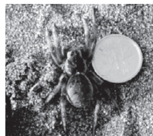
イソコモリグモ (コモリグモ科)