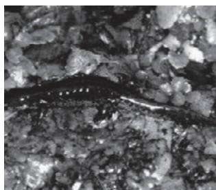
ホクリクサンショウウオ (サンショウウオ科)