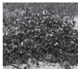
イソスミレ (スミレ科)