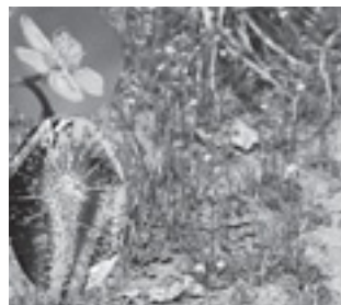
トウカイコモウセンゴケ (モウセンゴケ科)