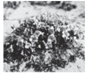
イソスマレ (スマレ科)