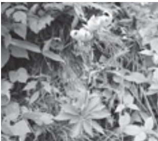
サドククルマユリ (ユリ科)