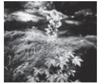
エチゼンダイモンジソウ (ユキノシタ科)