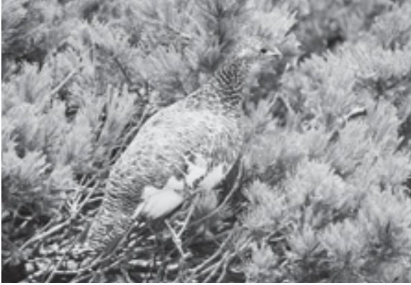
白山のライチョウ（平成24年6月7日撮影、環境省中部地方環境事務所）