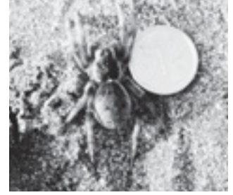
イソコモリグモ (コモリグモ科)