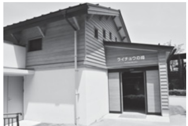
ライチョウの峰（平成23年4月オープン）

県では、ライチョウの種の保存に向けて、恩賜上野動物園や富山市ファミリーパークから近縁亜種であるノルウェー産のスバルバルライチョウをいしかわ動物園に受け入れ、飼育・繁殖技術の習得に取り組みはじめ、その拠点施設として、平成23年4月に「ライチョウの峰」をオープンさせ、この取組を県民に広く公開しています。