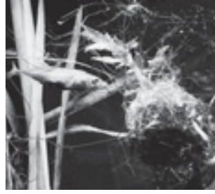
トミヨ (トゲウオ科)