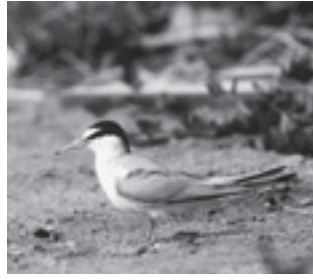
コアジサシ (カモメ科)