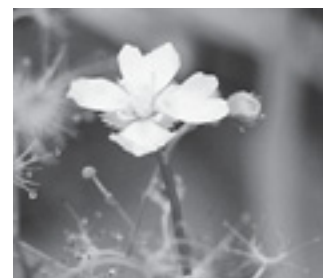
イシモチソウ (モウセンゴケ科)