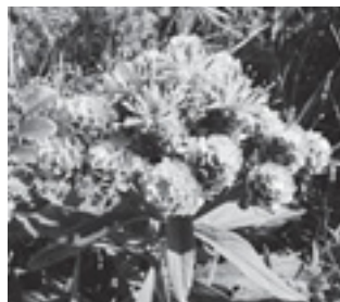
ヒメヒゴタイ (キク科)