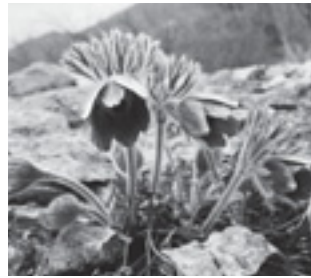
オキナグサ (キンポウゲ科)