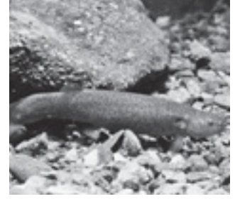
ホトケドジョウ (ドジョウ科)