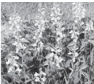
センダイハギ (マメ科)