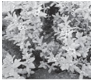
ウミミドリ (サクラソウ科)