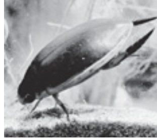
マルコガタノゲンゴロウ (ゲンゴロウ科)