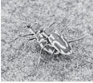
イカリモンハンミョウ (ハンミョウ科)