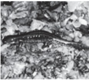
ホクリクサンショウウオ (サンショウウオ科)