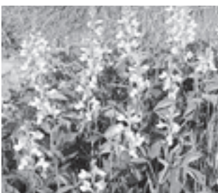
センダイハギ (マメ科)