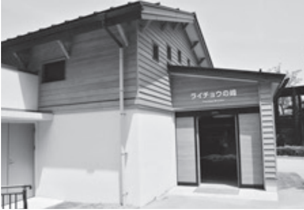
ライチョウの峰（平成23年4月オープン）