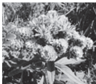
ヒメヒゴタイ (キク科)