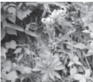
サドクマユリ (ユリ科)