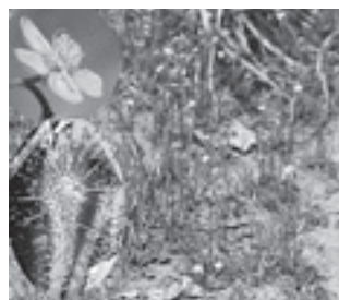
トウカイコモウエンゴケ (モウセンゴケ科)