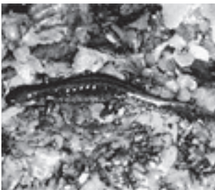
ホクリクサンショウウオ (サンショウウオ科)