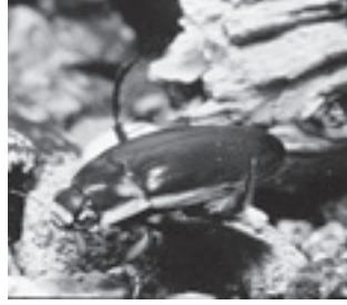
シャープゲンゴロウモドキ (ゲンゴロウ科)