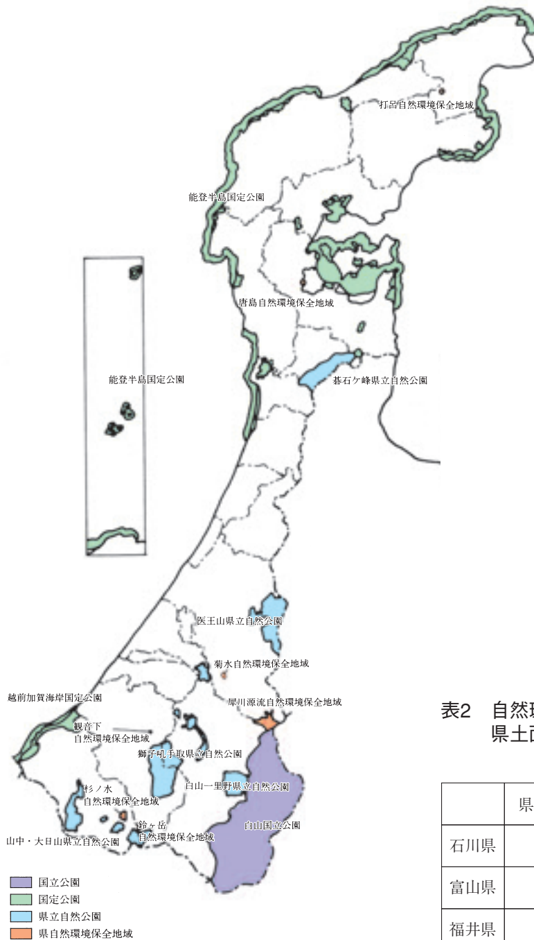
図1 自然環境保全地域と自然公園の指定現況図 (平成26年3月末現在)