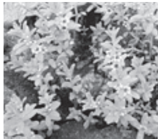
ウミミドリ (サクラソウ科)