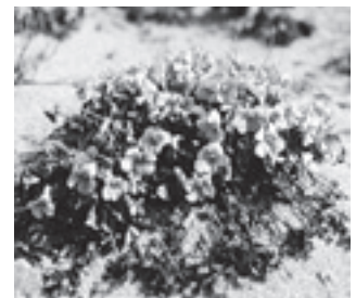
イソスミレ (スミレ科)