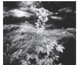
エチゼンダイモンジソウ (ユキノシタ科)