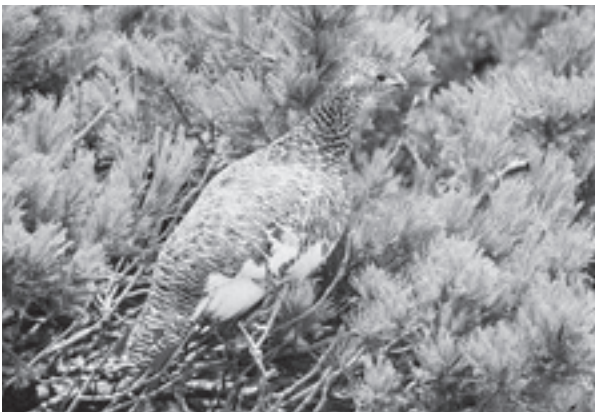
白山のライチョウ（平成24年6月7日撮影、環境省中部地方環境事務所）

白山は、かつてのライチョウの生息地であり、平成21年6月のライチョウの再確認は、大きなニュースとなって県民に明るい話題を提供しました。確認されたライチョウは、メスの1羽だけですが、翌平成22年、同23年そして平成24年になっても確認することができ、白山の自然の豊かさを象徴しています。今後も県では、環境省に協力し、生息状況の把握に努めてまいります。