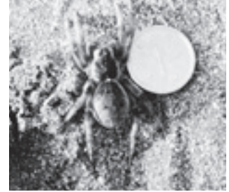
イソコモリグモ (コモリグモ科)