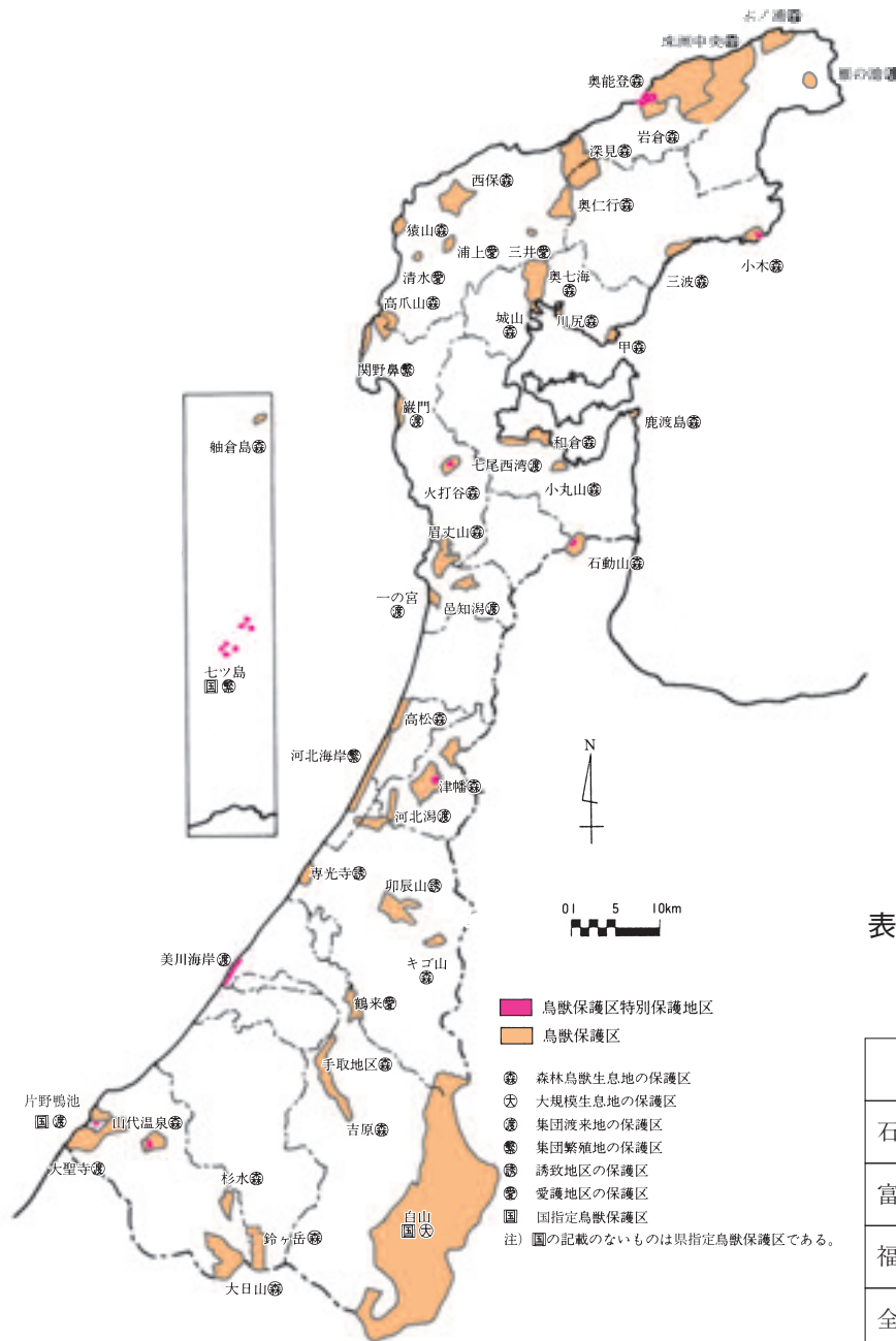
図2 鳥獣保護区と指定等現況図（平成26年3月末現在）