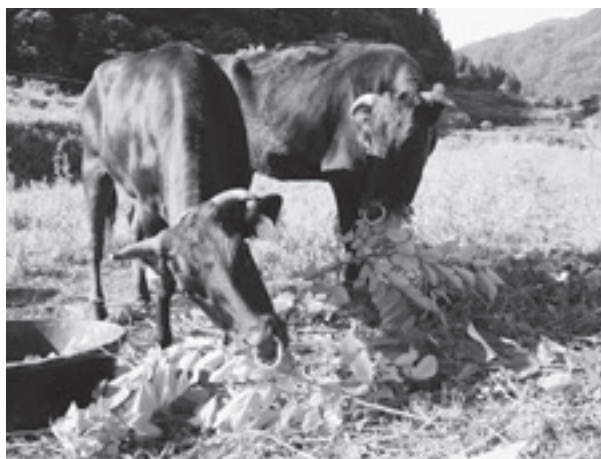
和牛放牧（白山市木滑）

この国の助成は、「鳥獣による農林水産業に係る被害の防止のための特別措置に関する法律（鳥獣被害防止特別措置法）」に基づき策定される鳥獣被害防止計画の内容に応じたものになることから、県では、各地域協議会が国からの助成を受けやすくなるよう、計画の策定を支援するなど、被害防止対策に努めています。