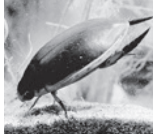
マルコガタノゲンゴロウ (ゲンゴロウ科)