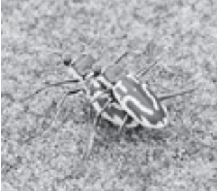
イカリモンハンミョウ (ハンミョウ科)