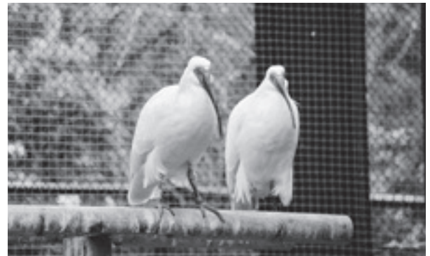
いしかわ動物園で飼育中のトキ

今後も、トキを通じて里山の利用保全を推進するなど、人と自然の共生の取組を進めていきたいと考えています。