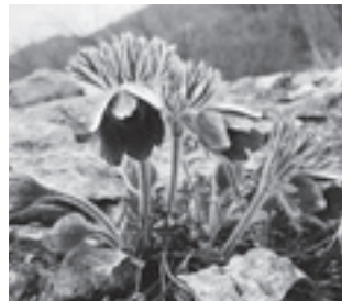
オキナグサ (キンポウゲ科)