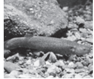
ホトケドジョウ (ドジョウ科)