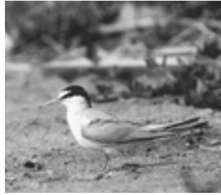
コアジサシ (カモメ科)