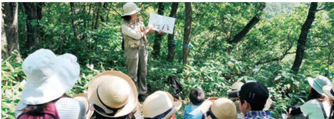
夕日寺健民自然園における里山体験