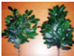
左は中国産。右は自生する能登のサカキ

現在、花き市場に流通するサカキの約90%は中国産が占めるが、能登産のサカキは艶があり、持ちが良いことから、小売店の需要が高い。