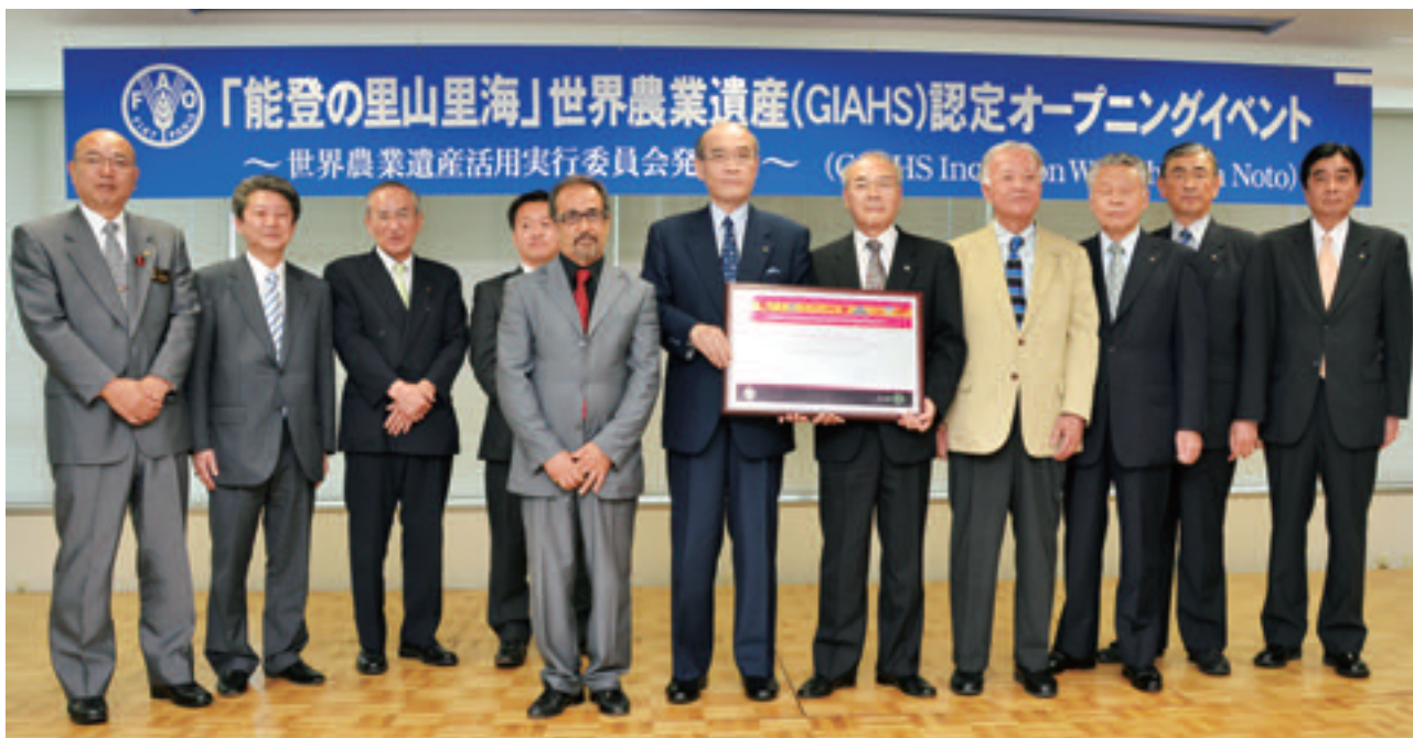
世界農業遺産活用実行委員会発足式（平成23年6月）