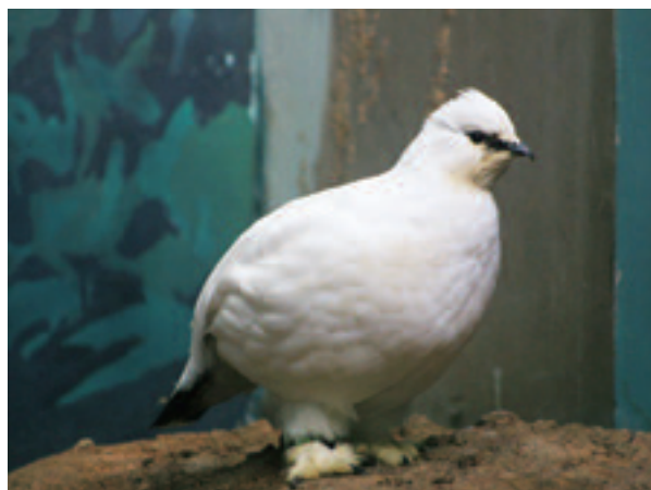
日本産ライチョウの種の保存に向けたスバルバルライチョウの飼育（いしかわ動物園）