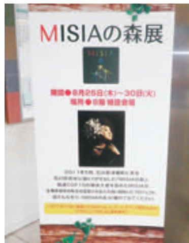
記念イベントのポスター