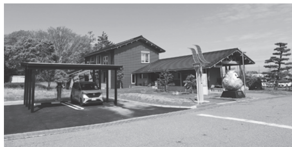
いしかわエコハウス

特徴：高气密・高断熱（断熱材、二重ガラス窓）施工 住宅用太陽光発電パネル（段状に設置するパネル、屋根一体型のパネル）の設置 卓越風を考慮し、自然風を多く取り入れる工夫（建物の向き、窓の位置等）など