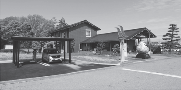
いしかわエコハウス