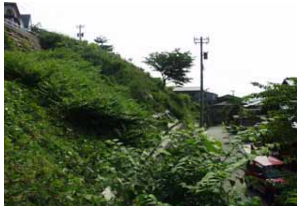
-2 植生工により緑化された現在の状況