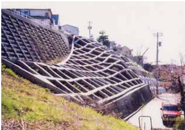
-1 施工直後の法枠工