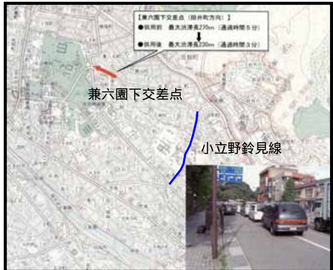
渋滞長の減少(兼六園下交差点)