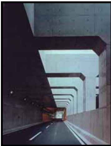
スリット構造採用による自然換気及び自然採光