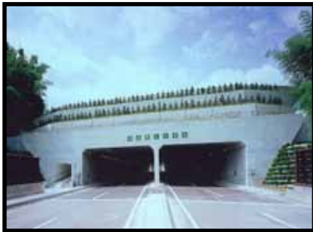
トンネル坑口部における斜面緑化