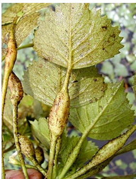
葉柄が膨らんで浮き袋になる