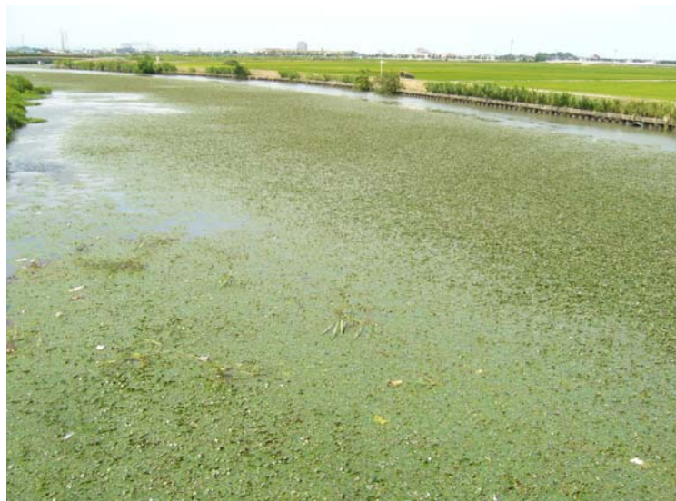
大宮川の水面を覆って広がるヒシの群落

ヒシは、ヒシ科の1年草で、日本全国の湖沼に生えており、種子は茹でて食べられます。かつては、河北潟など県内の湖には、ヒシやアサザが群生していましたが、近年では、大宮川に生育が確認される程度となっています。このため、県では、植生実験に取り組んでいます。