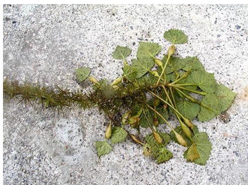
茎にたくさんの水中根が発達