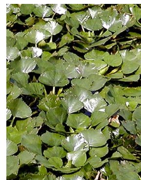
密集すると葉は空中に立つ