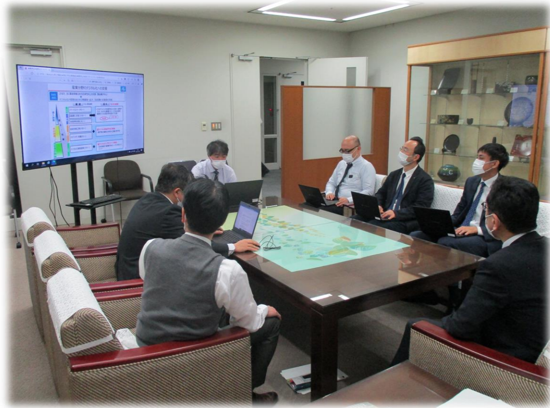
部長ヒアリングの様子