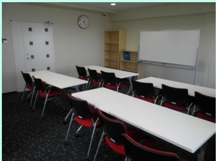
カンファレンスルーム(4階)