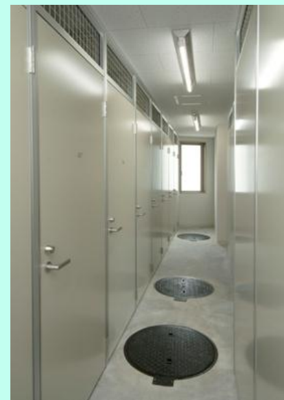
トランクルーム(各階)