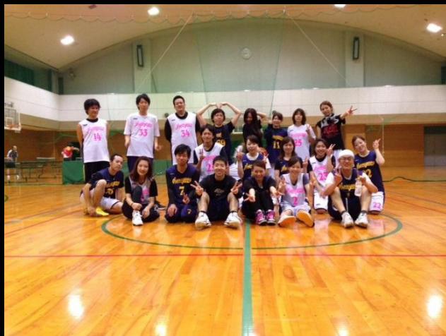
バスケット倶楽部