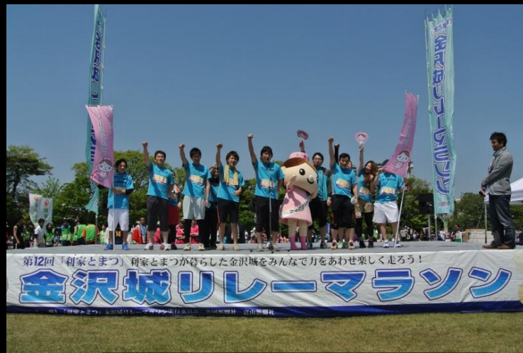
金沢城リレーマラソン

また、フィットネスクラブ『エイム』の法人会員であり、当院の職員であれば誰でもエイムを利用できます。