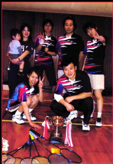
バドミントン倶楽部