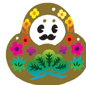
石川県観光PRマスコットキャラクター 「ひやくまんさん」