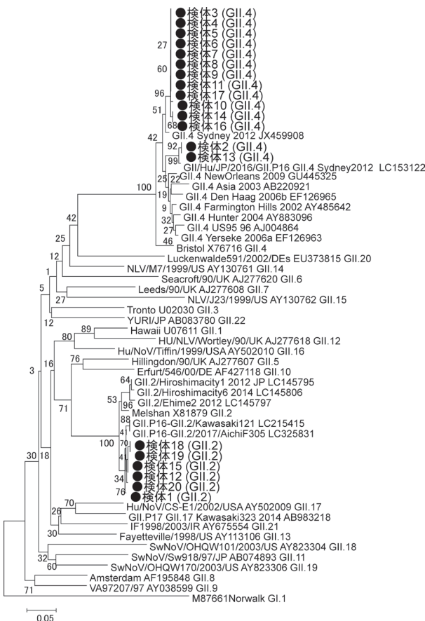
図 2 小児散発事例ノロウイルスGII系統樹 (カプシド領域)