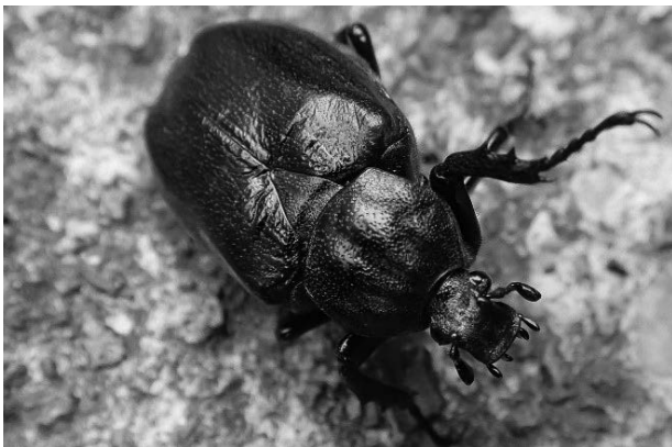
図11 オオチャイロハナムグリ

環境省レッドリスト2020準絶滅危惧，いしかわレッドデータブック2020準絶滅危惧。石川県では白山の夏緑広葉樹林帯から亜高山帯にかけて記録がある（石川むしの会・百万石蝶談会，1998；石川むしの会編集部，2017；平松他，2020b）。