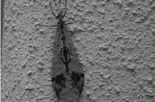
図5 マダラウスバカゲロウ 2019年9月6日