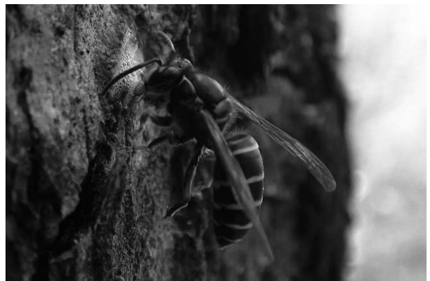
図23 キオビホオナガスズメバチ

環境省レッドリスト2020情報不足, いしかわレッドデータブック2020準絶滅危惧。石川県では主に白山の夏緑広葉樹林帯から亜高山帯にかけて分布しているが少ない(石川むしの会・百万石蝶談会, 1998)。