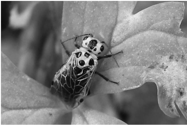
図21 シロズヒラタハバチ

環境省レッドデータリスト2020情報不足, いしかわレッドデータブック2020絶滅危惧Ⅰ類。これまで石川県では能登での記録があるだけ(石川むしの会・百万石蝶談会, 1998)で, 全国的にも稀な種である。