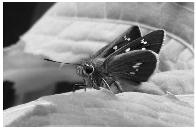
図16 オオチャバネセセリ

いしかわレッドデータブック2020準絶滅危惧。石川県では照葉樹林帯から夏緑広葉樹林帯で普通に見られていたが1990年代から観察数が減っている(竹谷, 2021; 石川むしの会編集部, 2021)。中宮展示館周辺では比較的多く観察され、ほぼ毎年撮影されている。