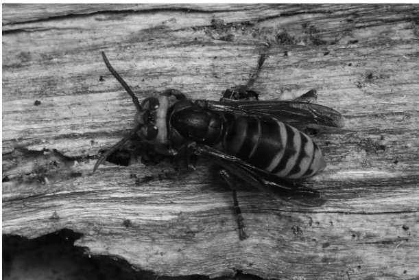
図24 モンスズメバチ 2015年9月3日

環境省レッドリスト2020情報不足。石川県では加賀地方の照葉樹林帯から夏緑広葉樹林帯を中心に記録されている（石川むしの会・百万石蝶談会, 1998）。