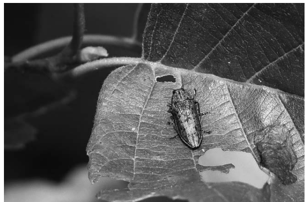
図7 エサキキンヘリタムシ 2018年7月28日

いしかわレッドデータブック2020準絶滅危惧。石川県では白山麓の夏緑広葉樹林帯で記録がある(石川むしの会・百万石蝶談会, 1998; 浅地, 2017) が