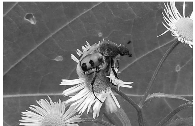
図12 トラハナムグリ

いしかわレッドデータブック2020準絶滅危惧。石川県では照葉樹林帯から夏緑広葉樹林帯にかけての