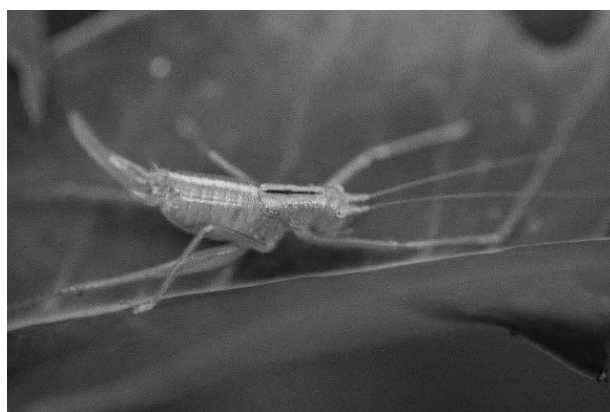
図3 キタササキリモドキ

石川県では近年加賀地域の照葉樹林帯を中心に記録されている(富沢, 2013; 石川むしの会編集部, 2019; 2022)。中宮展示館周辺では2023年10月に撮