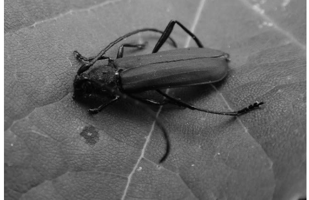
図13 ムモンベニカミキリ