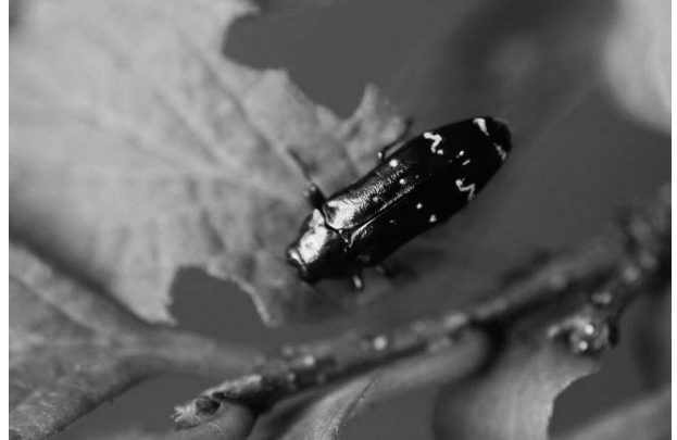
図6 ミヤマナカボソタムシ 2017年9月16日