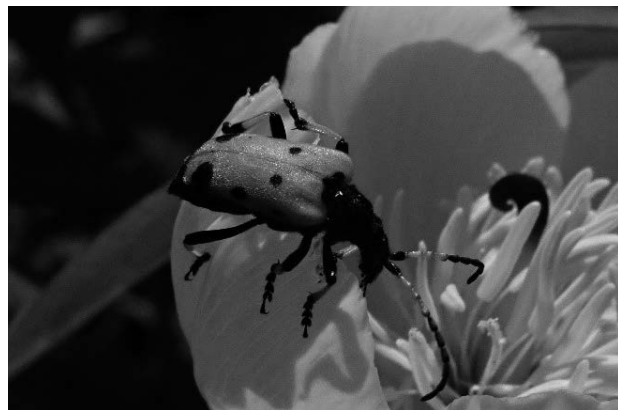
図14 フタスジカタビロハナカミキリ

9-V-2023 (図14). いしかわレッドデータブック2020準絶滅危惧。石川県では白山麓の夏緑広葉樹林帯にかけて記録があるが多くない（石川むしの会・百万石蝶談会, 1998）。