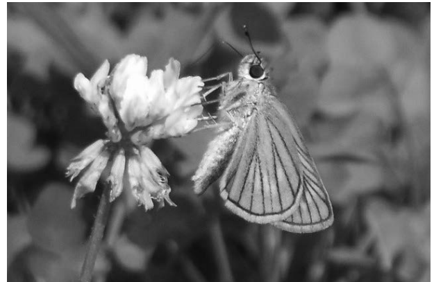
図15 ヘリグロチャバネセセリ