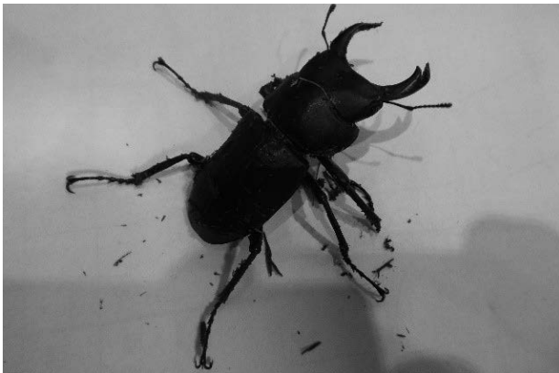
図8 ヒメオオクワガタ 2015年8月16日

いしかわレッドデータブック2020絶滅危惧Ⅱ類。 石川県では標高1,000m以上の地域での記録がほとんど(石川むしの会・百万石蝶談会, 1998; 平松他, 2020b)で, 中宮展示館周辺での記録はそれらに比べて低い。