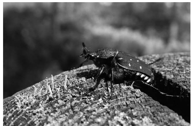
図9 アオアシナガハナムグリ 2015年6月2日

Gnorimus subopacus (Motschulsky) アオアシナガハナムグリ 2-VI-2015 (図9); 15-VI-2015.