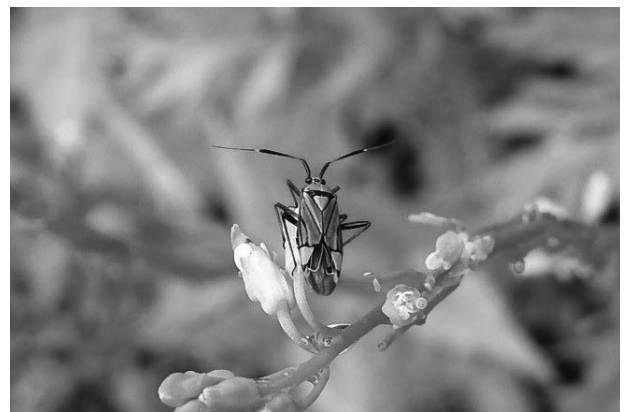
図4 シマアオカスミカメ 2023年5月23日

Mermilocerus annulipes Reuter シマアオカスミカメ 5-VI-2018; 29-V-2022; 23-V-2023. (図4)