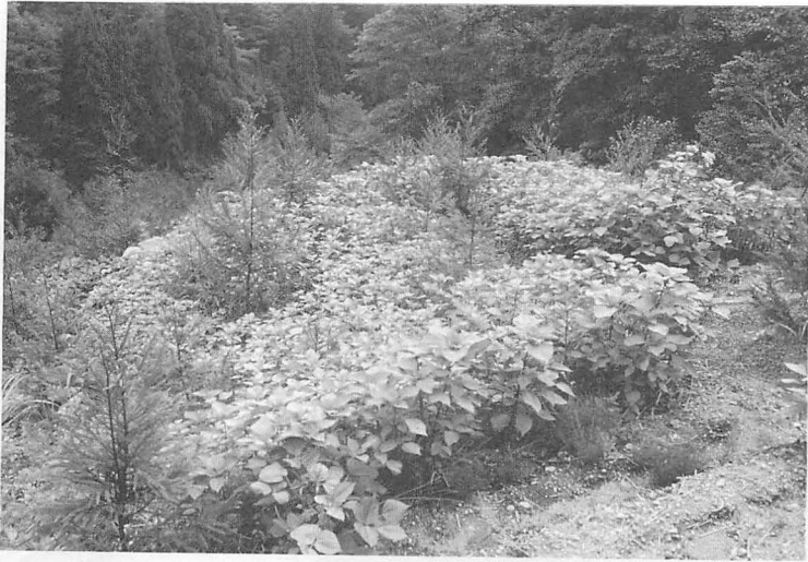
写真3 焼畑のステエゴマ（石川・白峰村小赤谷） 休閑1年目、スギを植林してあり、その間にエゴマを播きつめている。