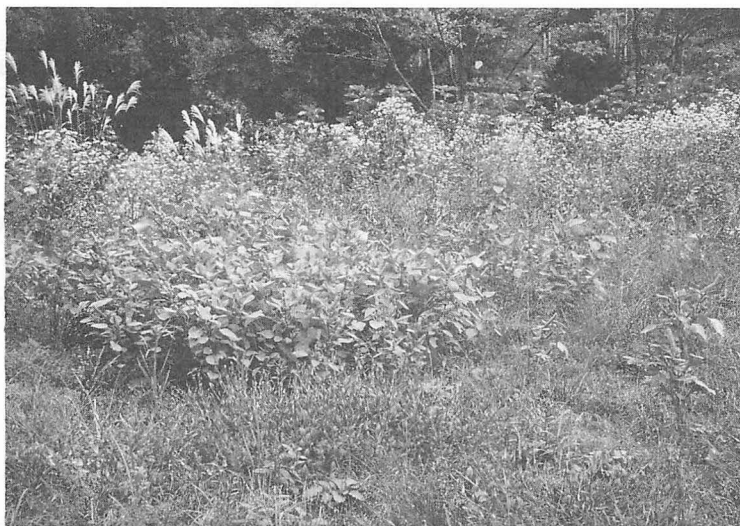
写真9 休耕畑で自生をくりかえすエゴマのフルセ (中央左の群落, 石川・白峰村大空)