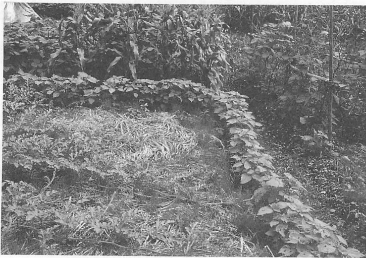
写真4 半分畑のエゴマ（石川・鳥越村左隣） 常畑と農道の境界に、自分の畑地をとりかこむようにエイを作っている。