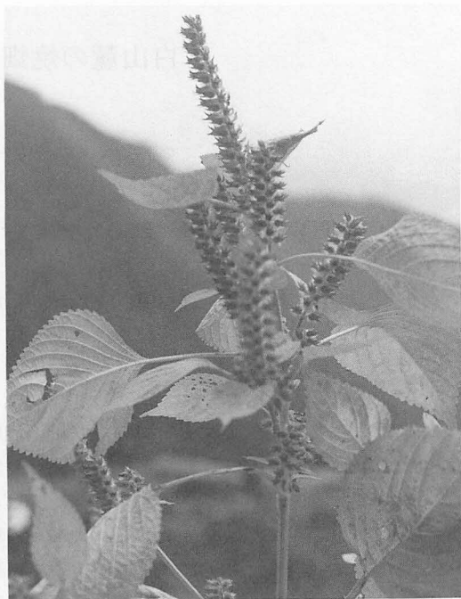
写真2 収穫前のエゴマの実 (石川・白峰村大空)

特色である。白山麓のエゴマが、ナラ林を焼き払って栽培していた事実と、鳥浜貝塚のエゴマが照葉樹林を焼き払って栽培していた事実は、歴史的時間を超越して比較すれば、いずれも旧植生を火で破壊して農耕をすること、すなわち焼畑で農耕をしている点では、全く同じ技法である。