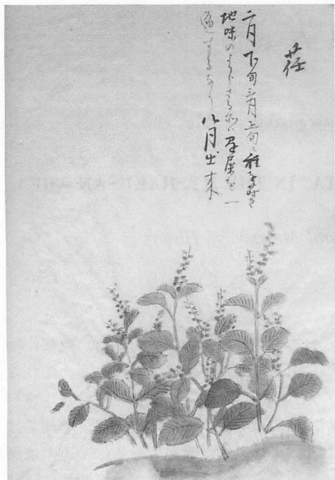
写真1 『民家検券会』 (北村忠良、嘉永2年序、 石川県立歴史博物館蔵) に描かれたエゴマ。