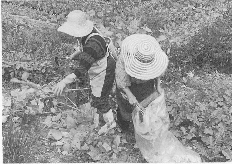
写真5 エゴマの刈取り (岐阜・白川村椿原) 熟し過ぎの実は、飛びはじけるので、ビニール袋の中で振り落としてから束ねる。