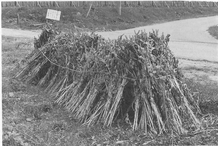
写真6 エゴマの乾燥 (岐阜・白川村有家ヶ原) はじけやすいので少し早めに刈り、天日で乾かす。

が発生し新芽を食い荒すので、5月の声を聞くとすぐエイを播くとしている。「エイ苗は、コヤシがあると柔らかなる。」とも言い、肥料分が多いと過長苗となって移植作業がやりにくくなるので、肥料分の残っていない畑地を苗床に当てねばならない。