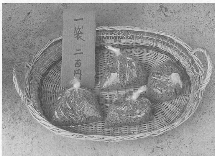
写真8 無人販売スタンドのエゴマ (岐阜・白川村鳩ヶ谷) 最近では白種種が作られるが、珍しく黒種種を売っている。 買うのは殆んど地元の人。