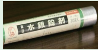
(参考一例) 水銀錠剤

水銀含有農薬には、大きく、紙袋入りの「いもち病対策」と、錠剤の「種子消毒・土壌殺菌用」があります。昭和48年に使用が禁止されましたが、現在でも毎年水銀含有農薬が処理されている実績があり、その多くは大掃除などの機会に排出されています。