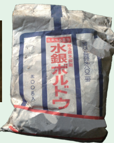
(参考一例) 水銀ボルドウ