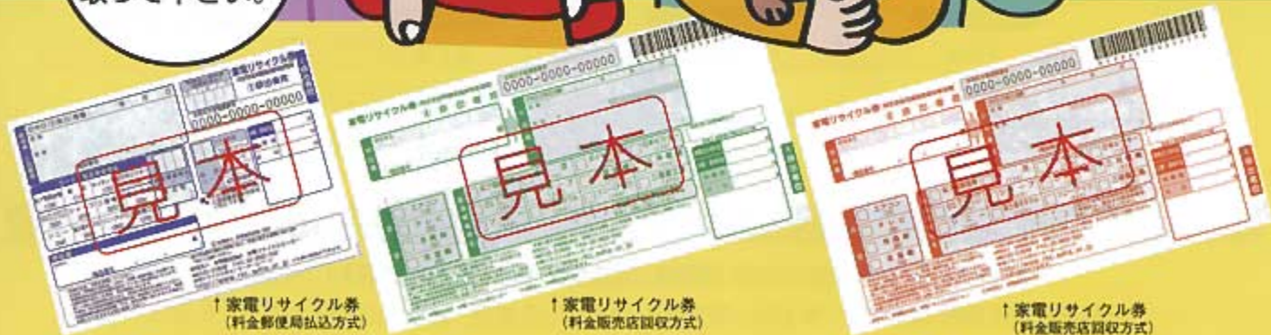
↑家電リサイクル券 (料金郵便局払込方式)