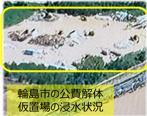
輪島市の公費解体 仮置場の浸水状況