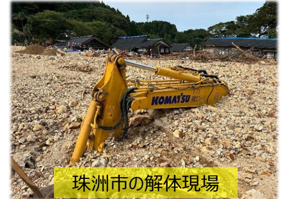
珠洲市の解体現場