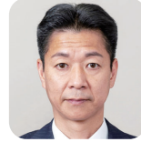
へぼ ひろかつ 馬場 弘勝(1期) (自由民主党)