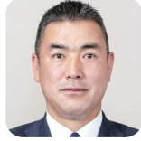
しみず しんいちろう 清水 真一路(2期) (自由民主党)