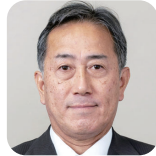
たかふじ のぶゆき 高辻 伸行(1期) (自由民主党)