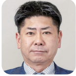
くらま ゆきひろ 車 幸弘(3期) (自由民主党)