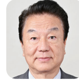
さくの ひろあき 作野 広昭(6期) (自由民主党)