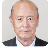
なかむら いきお 中村 勲(7期) (自由民主党)