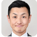
ふわ ひろひと 不破 大仁(4期) (自由民主党)