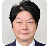
たなか たかひと 田中 敬人(3期) (自由民主党)