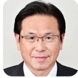
あんじつ たかなお 安実 隆直(3期) (自由民主党)