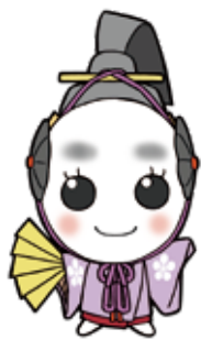
石川県議会 マスコットキャラクター