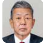
紐野 義昭 自由民主党・9期