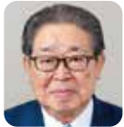
福村 章 自由民主党・12期