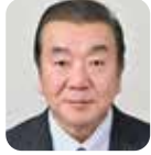
下沢 佳充 自由民主党・8期