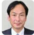
副議長 平蔵 豊志 自由民主党・4期