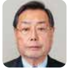
稲村 建男 自由民主党・11期