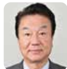
作野 広昭 自由民主党・6期