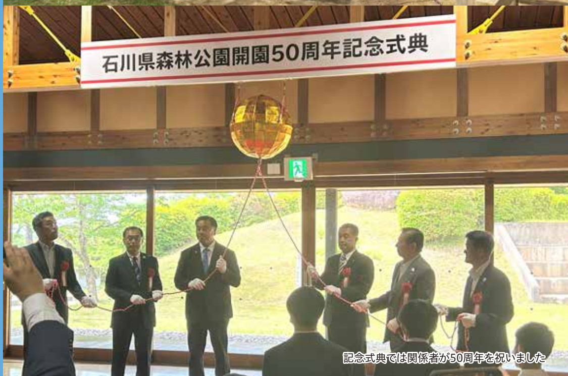
記念式典では関係者が50周年を祝いました