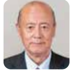
中村 勲 自由民主党・7期