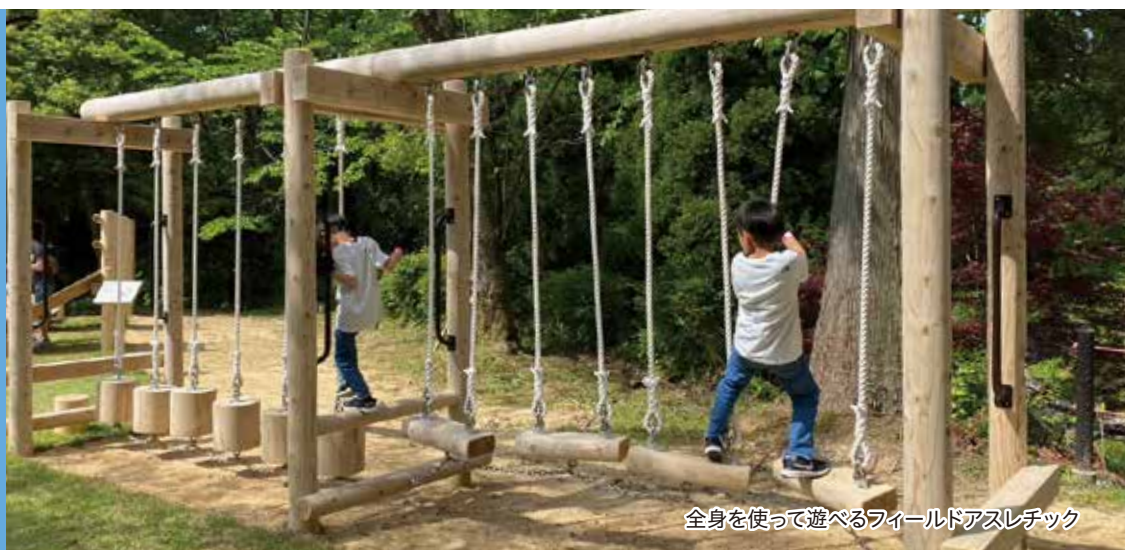
全身を使って遊べるフィールドアスレチック

県議会としましても、多くの県民の皆様にご利用いただけるよう、より一層魅力ある公園として充実・発展するため力を尽くしてまいります。