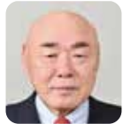
和田内 幸三 自由民主党・9期