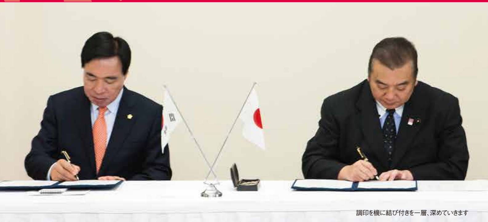
調印を機に結び付きを一層、深めています

産業や観光など、私たちの生活にも深くかかわるさまざまな分野で国際化が進んでいます。石川県議会でも、海を越えたアジア地域の地方議会などとの交流を深めています。