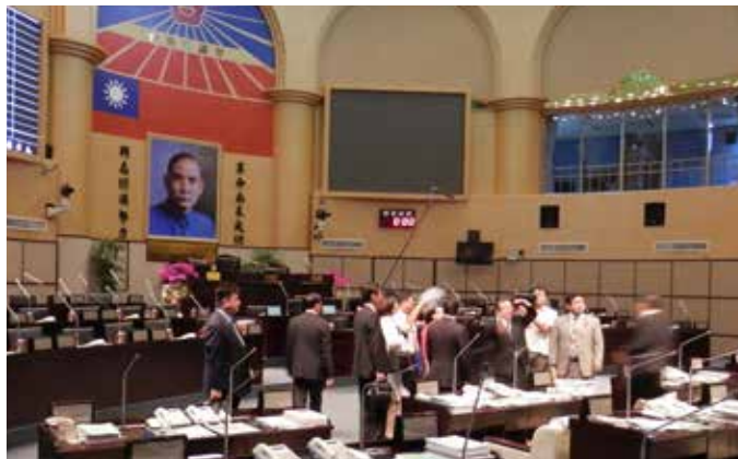
台南市議会を見学する訪問団

1日1往復の国際定期便が就航し、結び付きが強まっている台湾との交流も活発化しています。平成23年には、石川県議会の議員9人が台湾南西部の台南市議会を表敬訪問し、「友好交流に関する協定書」を結び、さまざまな分野で台南市との国際交流を促進していくことを誓い合いました。