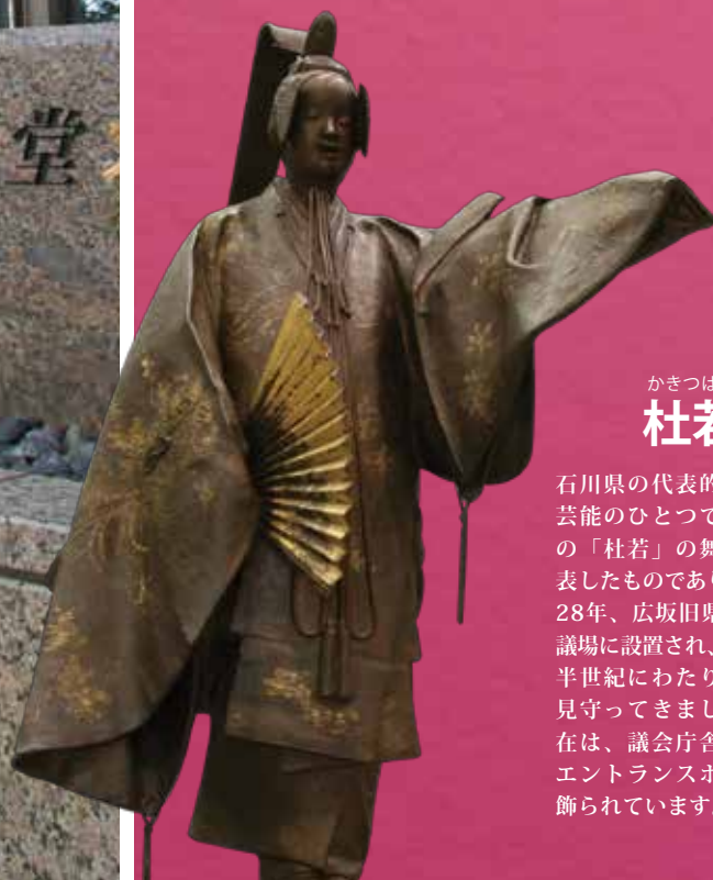
かきつばた 杜若像

石川県の代表的な伝統芸能のひとつである能の「杜若」の舞い姿を表したものであり、昭和28年、広坂旧県庁舎の議場に設置され、以来、半世紀にわたり論戦を見守ってきました。現在は、議会庁舎1Fのエントランスホールに飾られています。