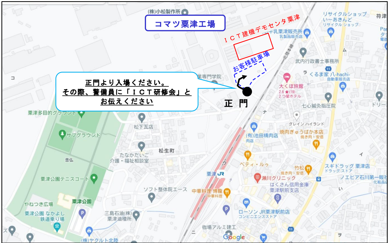
(コマツ粟津工場 鳥瞰図)