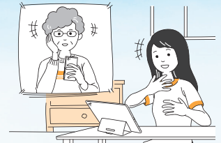
●家族や友人との会話