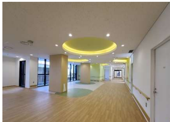
診察棟(2階児童発達障害エリア)