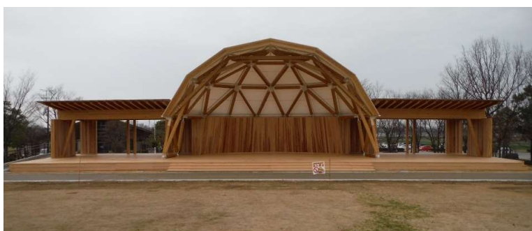
植樹祭終了後、休憩所として再整備