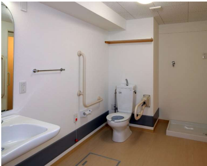
車いす用住戸 サニタリールーム

車いす利用者用住戸内は、車いすの回転スペースを十分に確保しているほか、避難の際には、バルコニー側からも避難できるように屋外側にスロープを設置している。