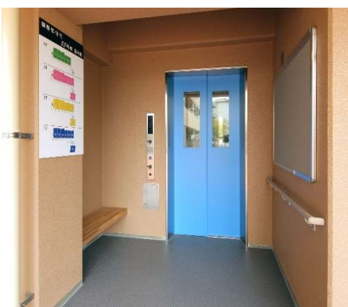
共用エレベーター

既存樹木を一部保存して、敷地中央部に芝生広場を設け住棟コミュニティ形成の一助としている。