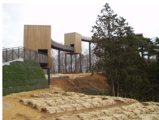
展望台までのスカイウォーク