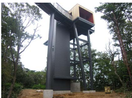
展望台を地上より望む

外壁には木材（県産）を使用しており、周囲の森に溶け込む落ち着いた色調となっている。