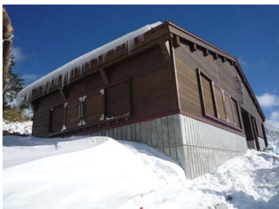
登山道より見える小屋の風景(冬)