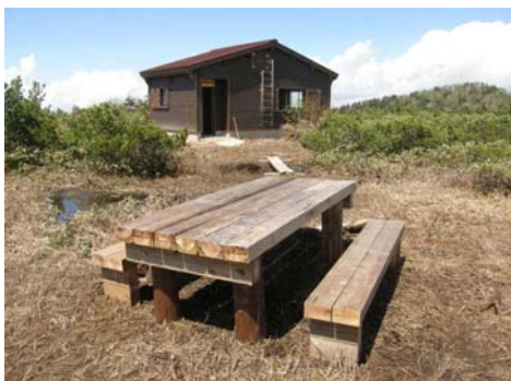
廃材を利用した机とベンチ

新岩間温泉方面から白山大汝峰を目指す、楽々新道の標高2020mの地点にある小桜平避難小屋を、老朽化により平成22年10月に建替をおこなった。小屋部分は床部分と土間、トイレがあり、10人収容できる。また、柱や梁、外壁材には県産の能登ヒバを使用しており、外部には旧の小屋の廃材を使用した机といすを設置している。