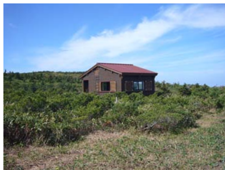
登山道より見える小屋の風景