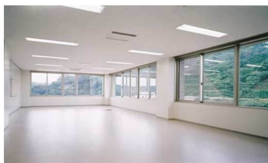
2階 事務室・操作室