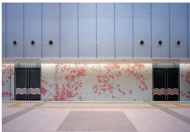
多目的ホール ホワイエ