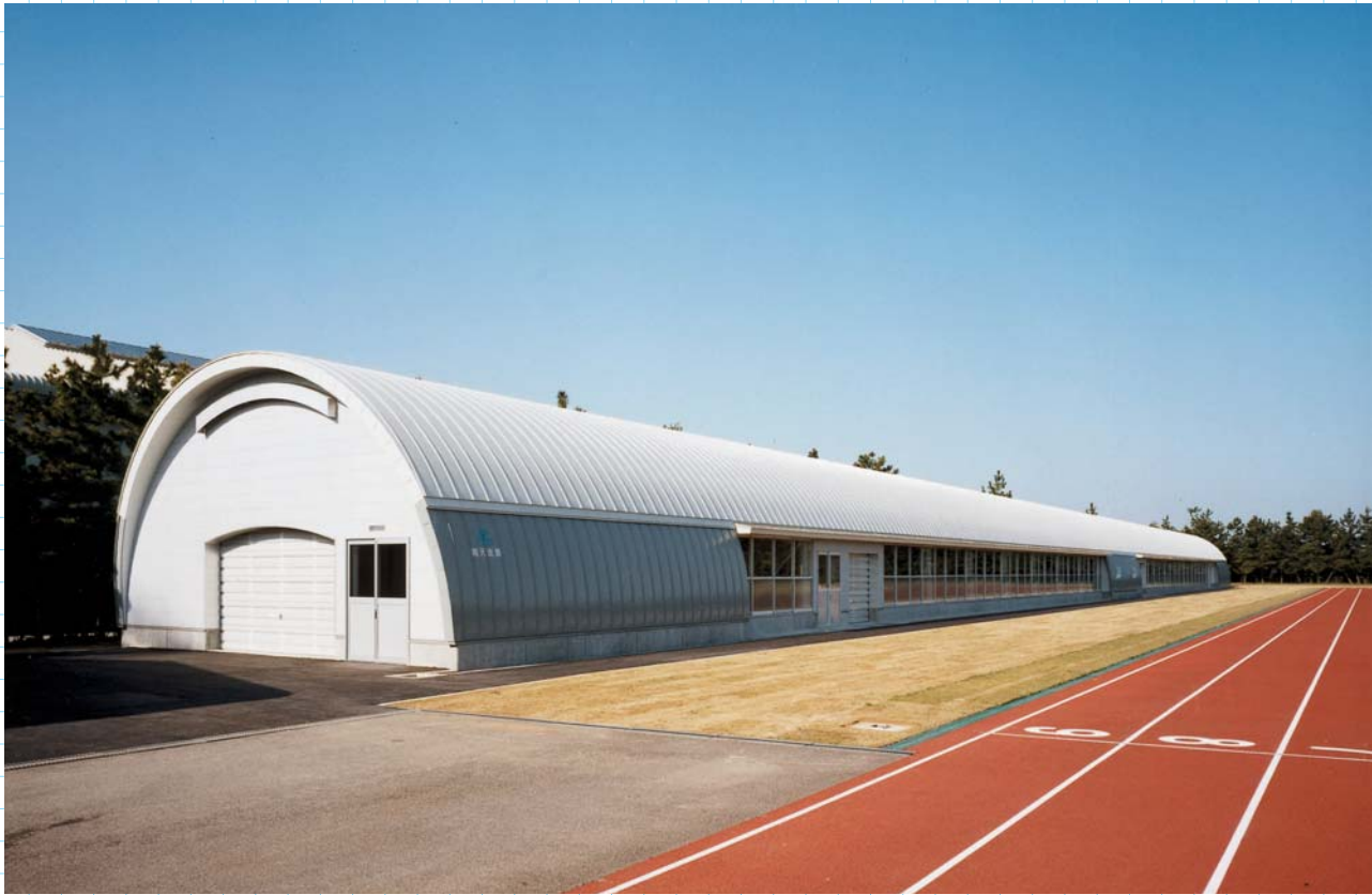
陸上競技場雨天走路棟