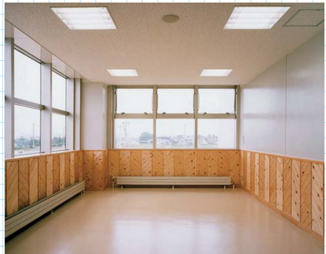
語り合いコーナー