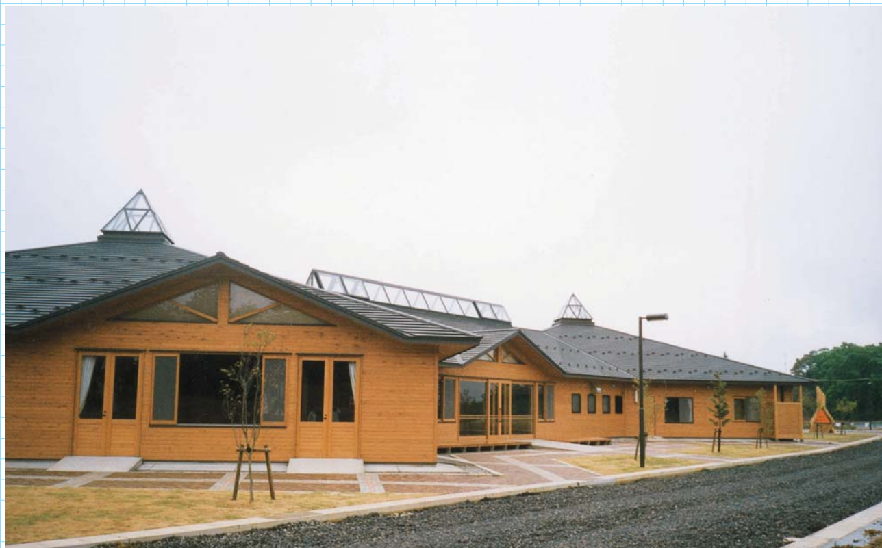
総合交流センター