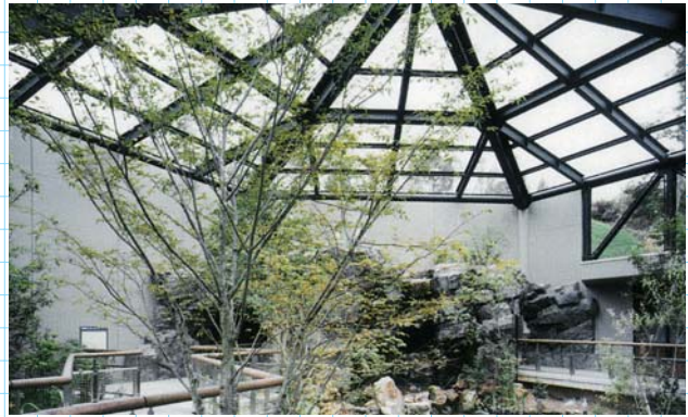
フライングゲージ