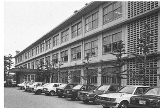
門前高等学校 鳳至郡門前町字広岡