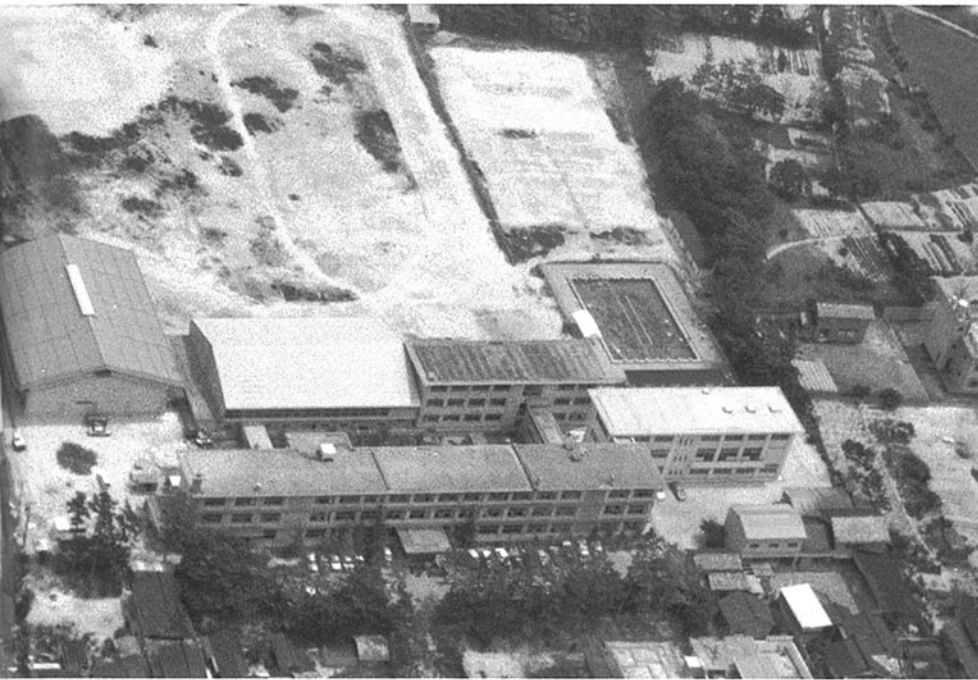
富来高等学校 羽咋郡富来町領家町