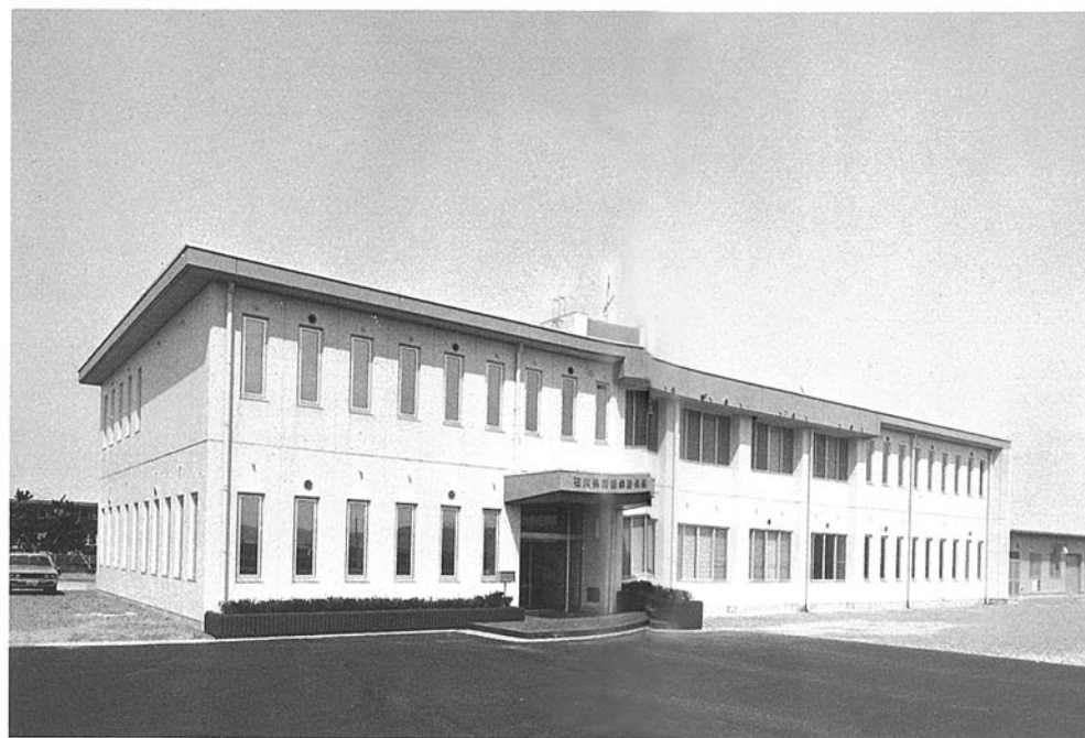
●竣工年度/S.56●構造/RC造 2階●延床面積/1,032㎡