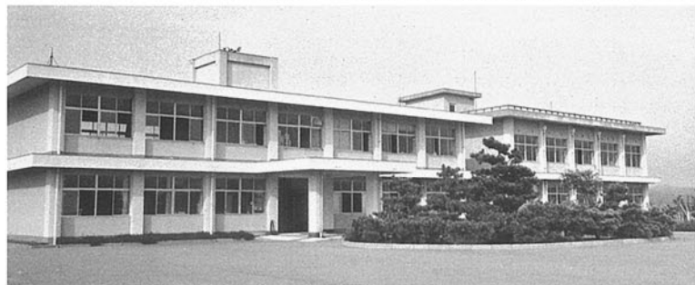
■砂丘地農業試験場 河北郡宇ノ氣町内日角井 ●竣工年度/S.42●構造/RC造 2階 ●延面積/869㎡(2,469㎡)