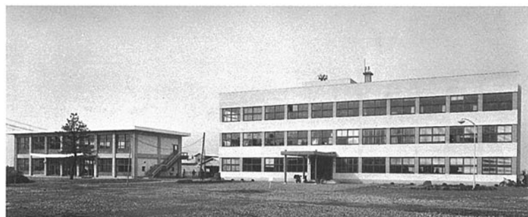
■農業試験場 石川郡野々市町中林 ●竣工年度/S.36●構造/RC造 3階●延面積/1,736㎡(8,890㎡)