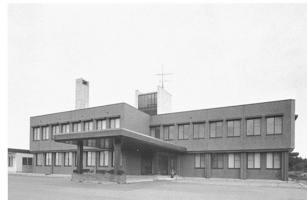
■北部家畜保健衛生所 鹿島郡田鶴浜町字大津 ●竣工年度/S.53●構造/RC造 2階●延床面積/887㎡(1,158㎡)