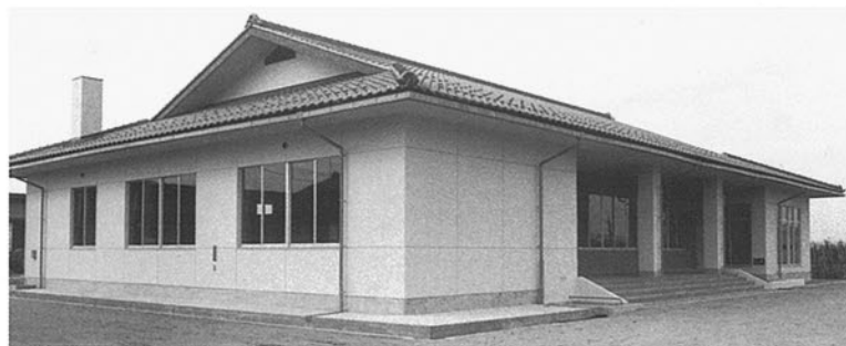
■河北湯宮農研修館 河北郡津幡町舟橋 ●竣工年度/S.55●構造/RC造 1階●延面積/442㎡(630㎡)