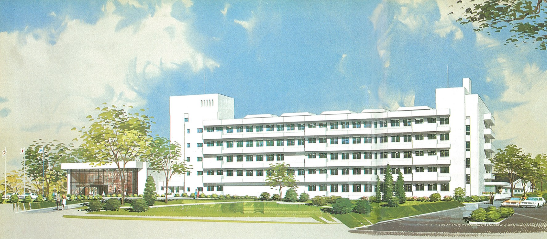
工業試験場 金沢市戸水町 ●竣工年度/S.58(予定)●構造/RC造 地下1階 地上5階 SRC造 2階 ●延床面積/10,399㎡・3,869㎡

新工業試験場の建設にあたっては、まず、技術変化に即応できる柔軟な機能として類似した技術分野の試験室をまとめ、極力大部屋とし、かつ、仕切りは構造上必要なもの以外はすべて簡易壁とし、室配置の変更を容易とした。