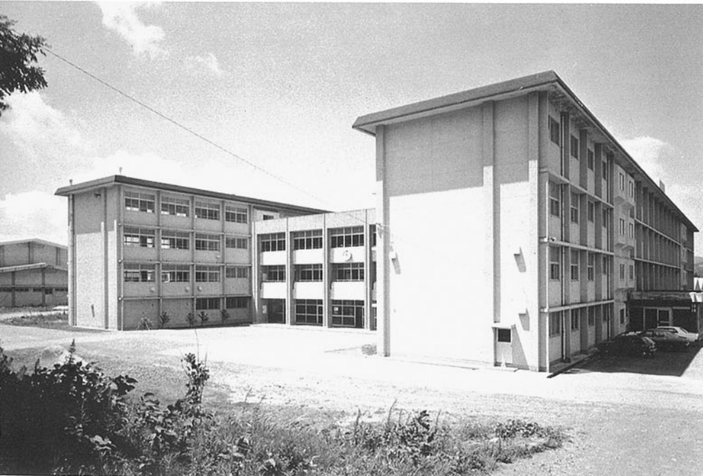
輪島実業高等学校 輪島市稲舟町字上野