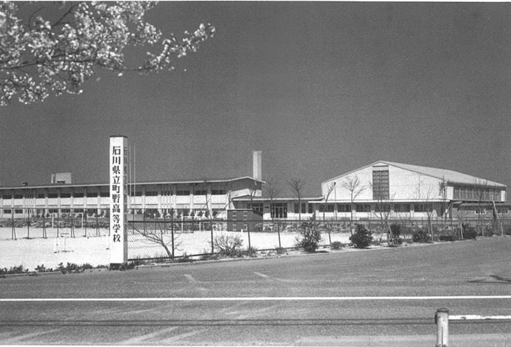
町野高等学校 輪島市町野町挿曾々木