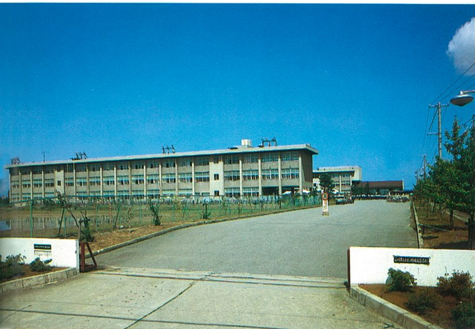
小松明峰高等学校 小松市平面町