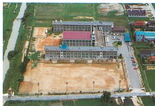
寺井高等学校 能美郡寺井町