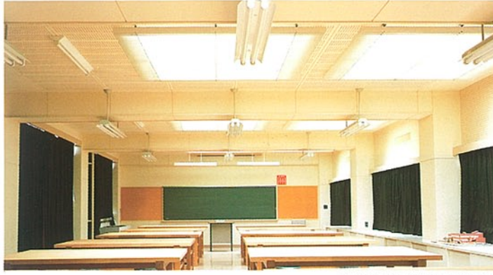
自然光を採用した製図室