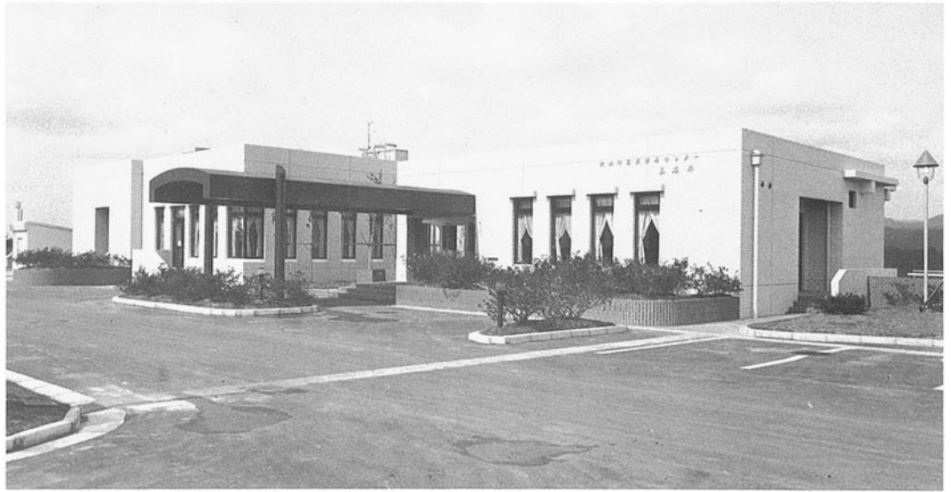
■国民保養センター真名井 鳳至郡穴水町 ●竣工年度/S.56●構造/RC造 2階●延床面積/1,056㎡