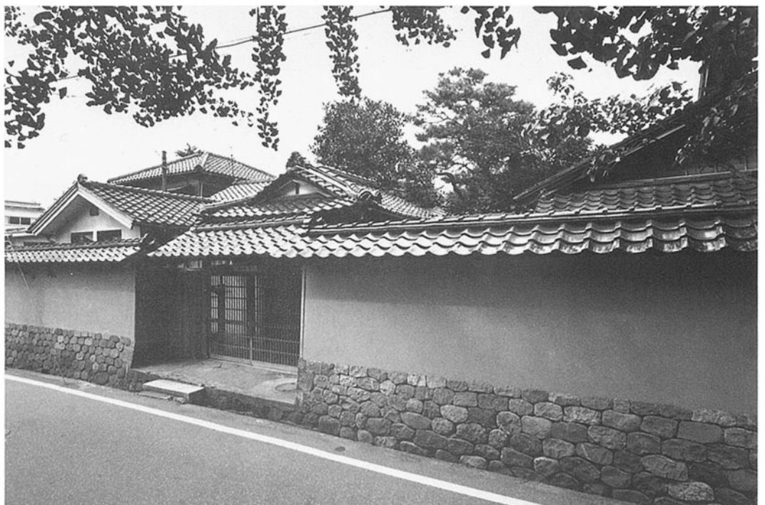
■城南荘 金沢市広坂 ●建築/M.20~30 改築/S.24●構造/W造 1階●延床面積/489㎡