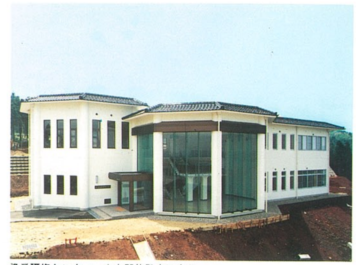
漁業研修センター 鹿島郡能登島町字曲 ●竣工年度/S.57 ●構造/RC造 2階 ●延床面積/871㎡