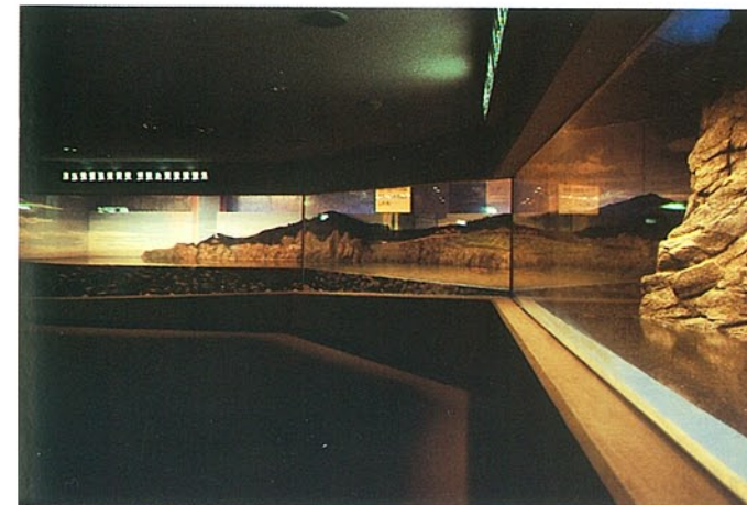
屋内水槽(のとの海)