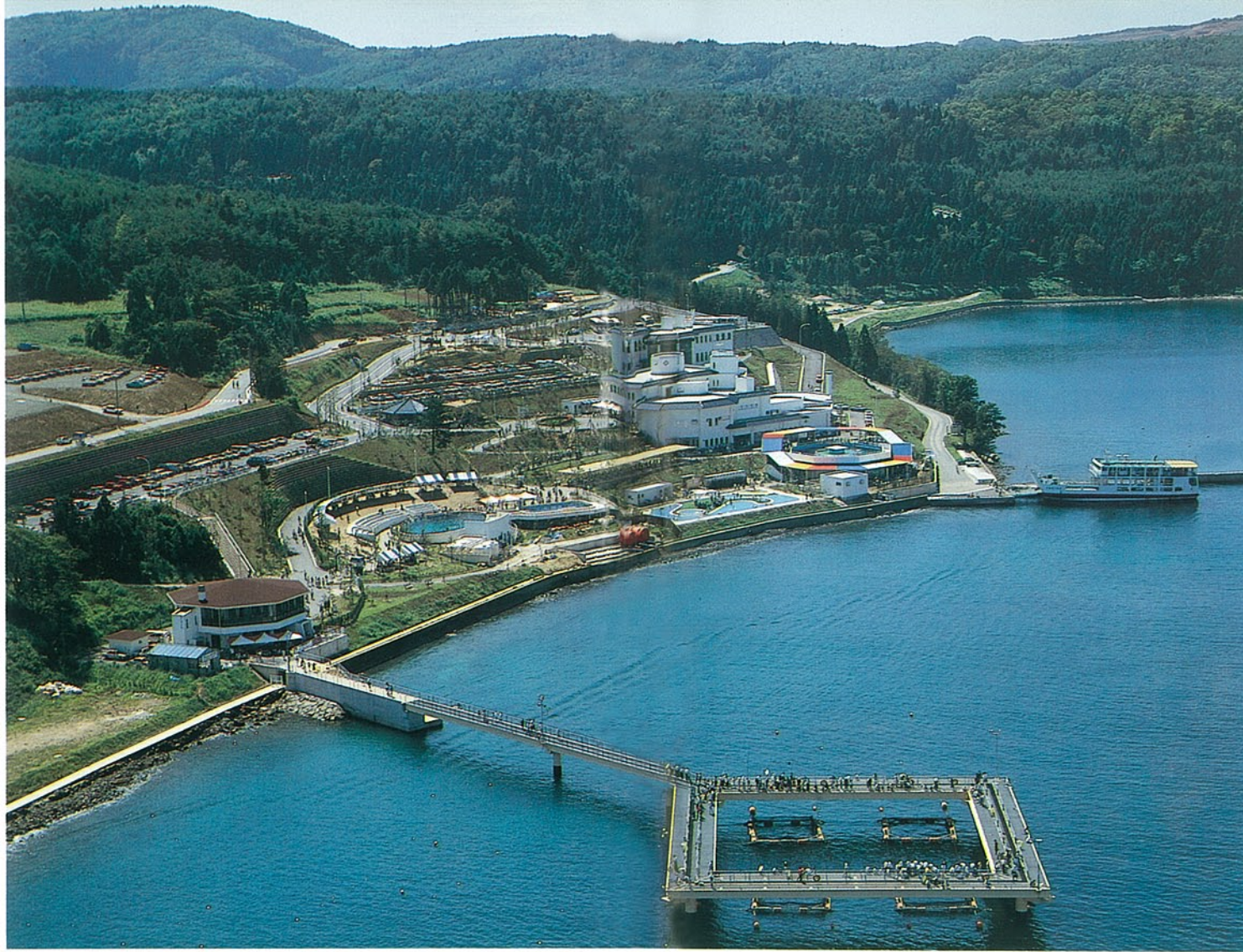
のとじま臨海公園水族館 鹿島郡能登島町字曲 ●竣工年度/S.57 ●構造/RC造 2階 ●延床面積/2,883㎡(3,425㎡)