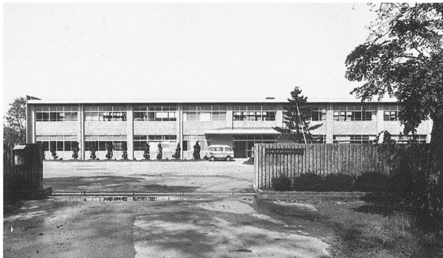
■児童生活指導センター 河北郡内灘町字大根布 ●竣工年度/S.48●構造/RC造 2階●延床面積/2,786㎡(2,834㎡)