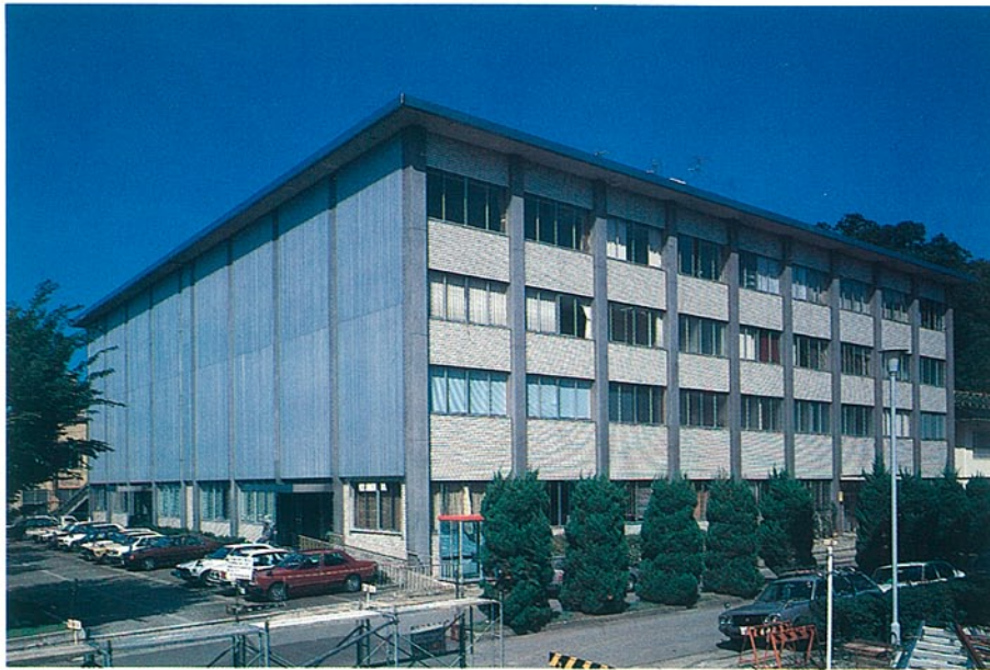
■社会福祉会館 金沢市本多町 ●竣工年度/S.47●構造/RC造 地下2階 地上4階●延床面積/4,195㎡