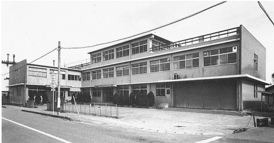
■七尾保健所 七尾市昭和町 ●竣工年度/S.44●構造/RC造 3階●延床面積/1,117㎡