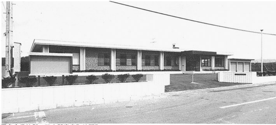
■富来保健所 羽咋郡富来町地頭町 ●竣工年度/S.54●構造/RC造 1階●延床面積/705㎡(808㎡)