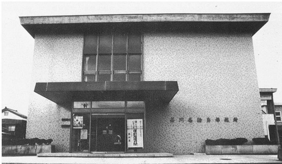
■輪島保健所 輪島市鳳至町島田 ●竣工年度/S.44●構造/RC造 2階●延床面積/1,255㎡(1,394㎡)