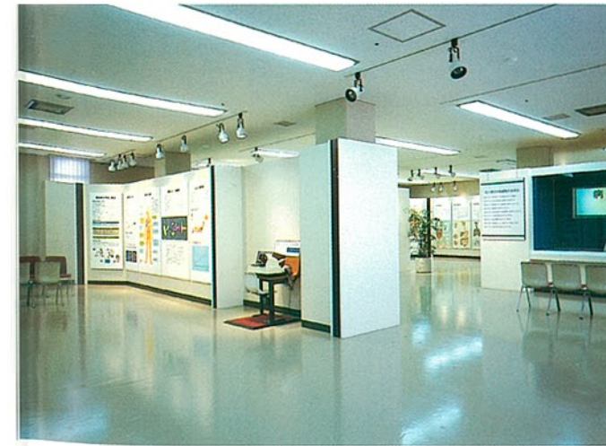
教育館展示ホール