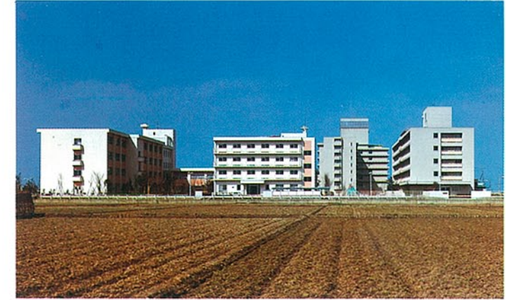
総合看護学院 金沢市南新保町 ●竣工年度/S.51 ●構造/RC造 4階 ●延床面積/4,866㎡(7,759㎡)