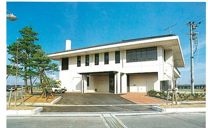
精神衛生センター 金沢市南新保町 ●竣工年度/S.56 ●構造/RC造 2階 ●延床面積/800㎡