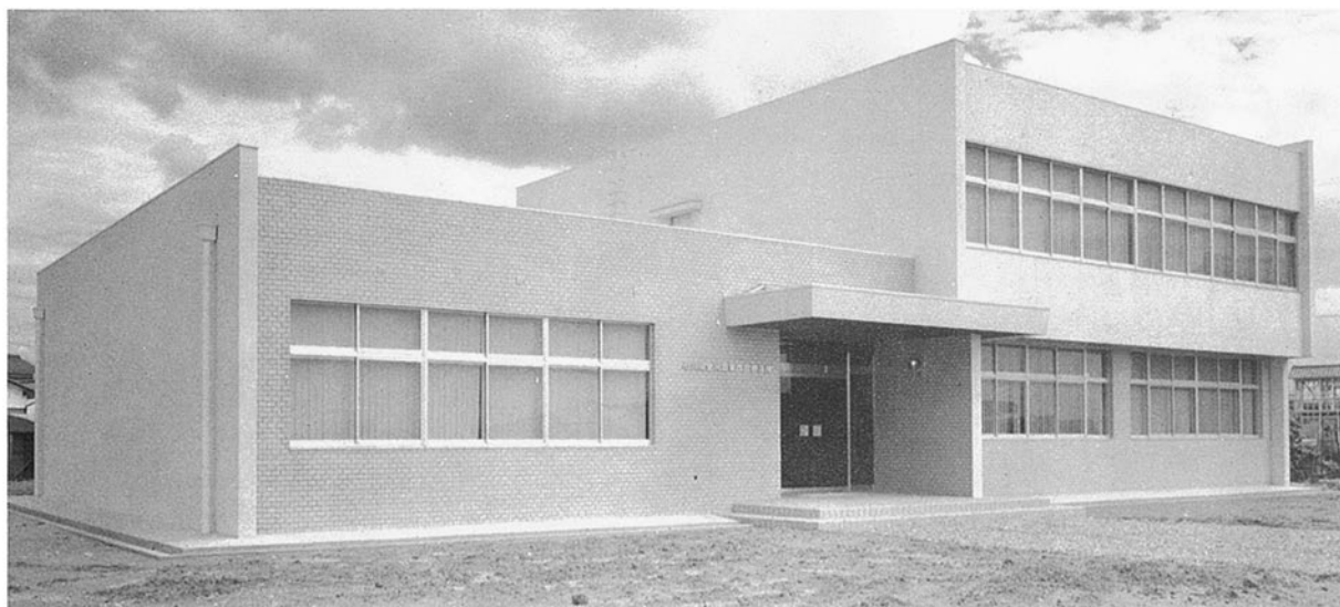
■金沢農業改良普及所 金沢市東力町 ●竣工年度/S.46●構造/RC造 2階●延床面積/503㎡(594㎡)