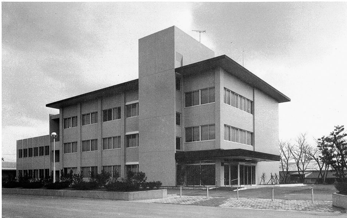
■羽咋農林合同庁舎 羽咋市旭町 ●竣工年度/S.53●構造/RC造 3階●延床面積/1,278㎡(1,828㎡)