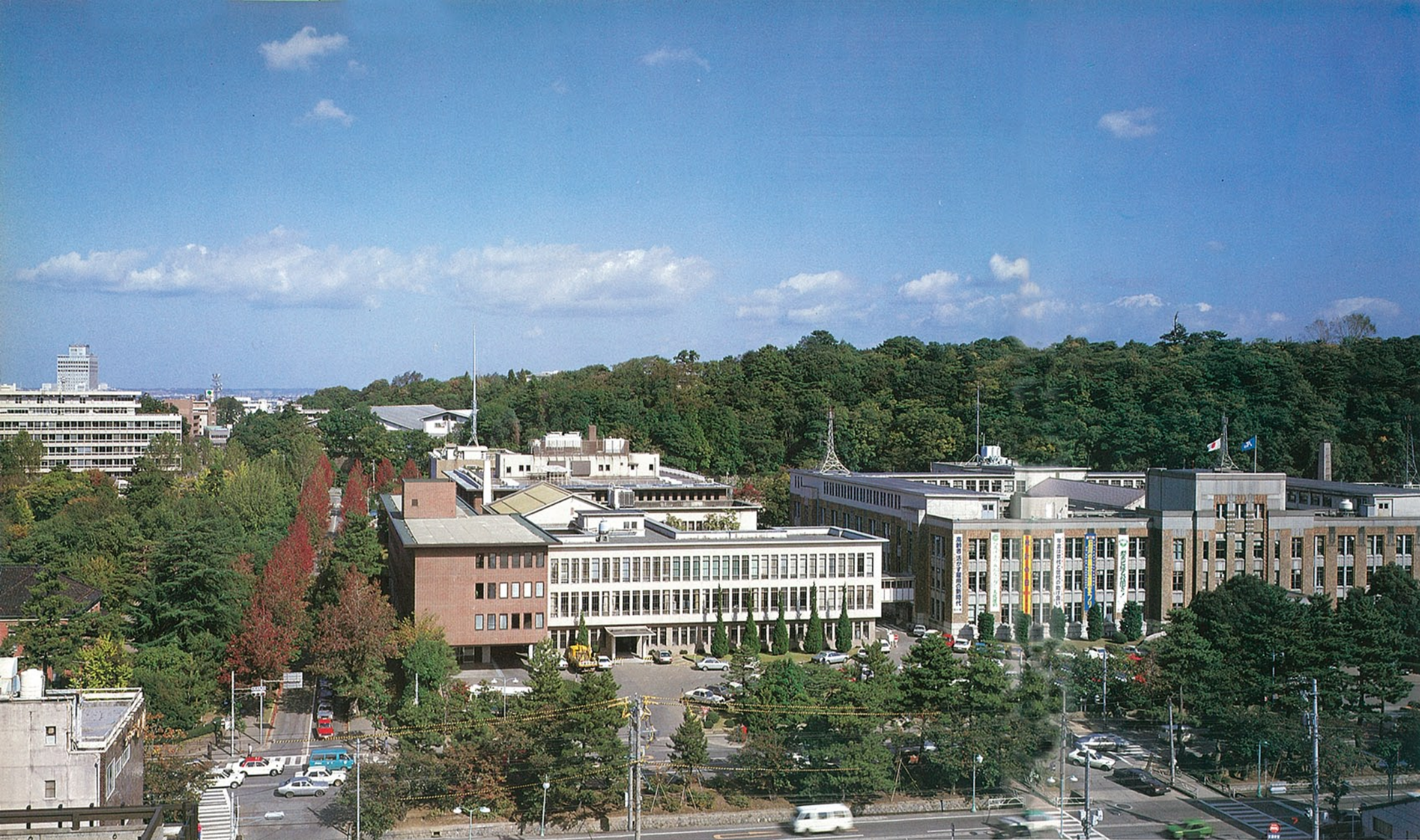
■石川県庁本館 金沢市広坂 ●竣工年度/T.13 ●構造/RC造 4階 ●延床面積/10,722㎡

当時、事務室面積が不足し、これを確保するため、本庁舎内講堂を廃止したり、ロッカーを廊下に並べることに許可を与えたり、また各課の境界トラブルの調整に走り回り、部・課の部屋割は、管財課の頭の痛い仕事でした。ために、別館建設が決まったとき、ほんとうにホッとしたものでした。