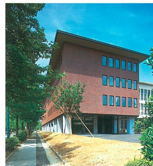
議会庁舎 ●竣工年度/S.54 ●構造/RC造 4階 ●延床面積/7,979㎡