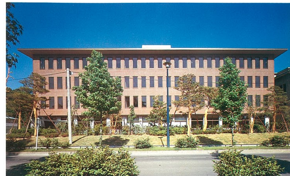
新館 ●竣工年度/S.49 ●構造/SRC造 地下 2階 地上 4階 ●延床面積/11,715㎡