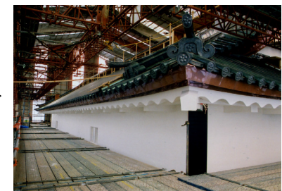
③二之門漆喰塗完了!