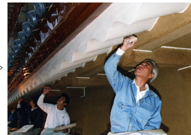
②垂木波形漆喰塗 垂木波形の凹凸面を塗る。