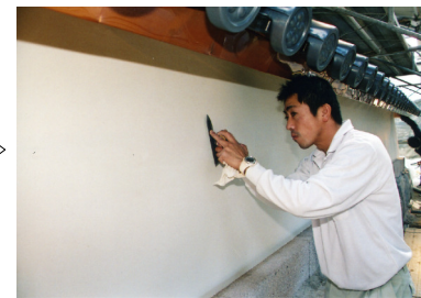
②漆喰押え 漆喰を押えることを何度も繰り返す。(写真は曲折土塀)