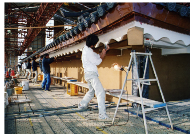
①垂木波形小口漆喰塗 垂木波形の小口面に漆喰を塗る。