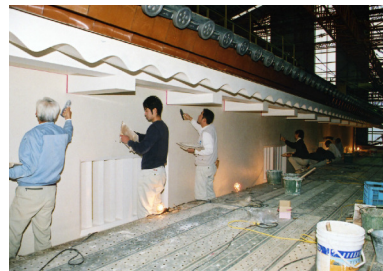
①漆喰塗 職人が一列に並び、漆喰の継目を作らないように一気に仕上げる。