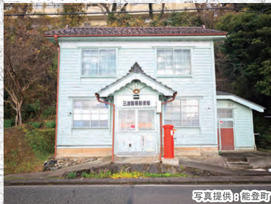
モダンな外観の郵便局